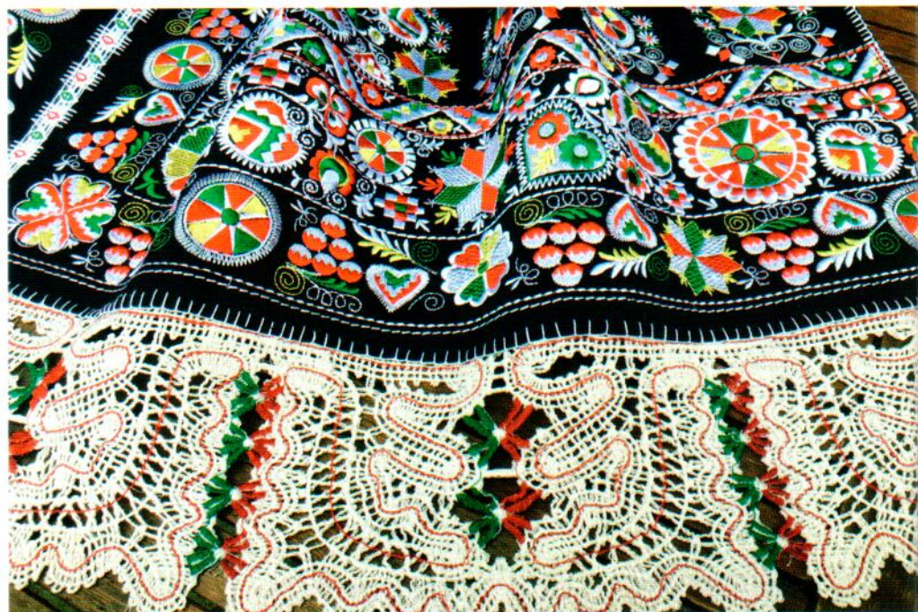
Zástěra z Kyjovska

Díky kreativnímu rodinnému zázemí tak už v dětství zvládla většinu vyšivkových stehů, z nichž k nejpoužívanějším v její tvorbě patří výšivka plná, křížková, richelieu, dírkové vyšívání, ukončování okrajů zoubkováním, ažury, prolamované výšivky