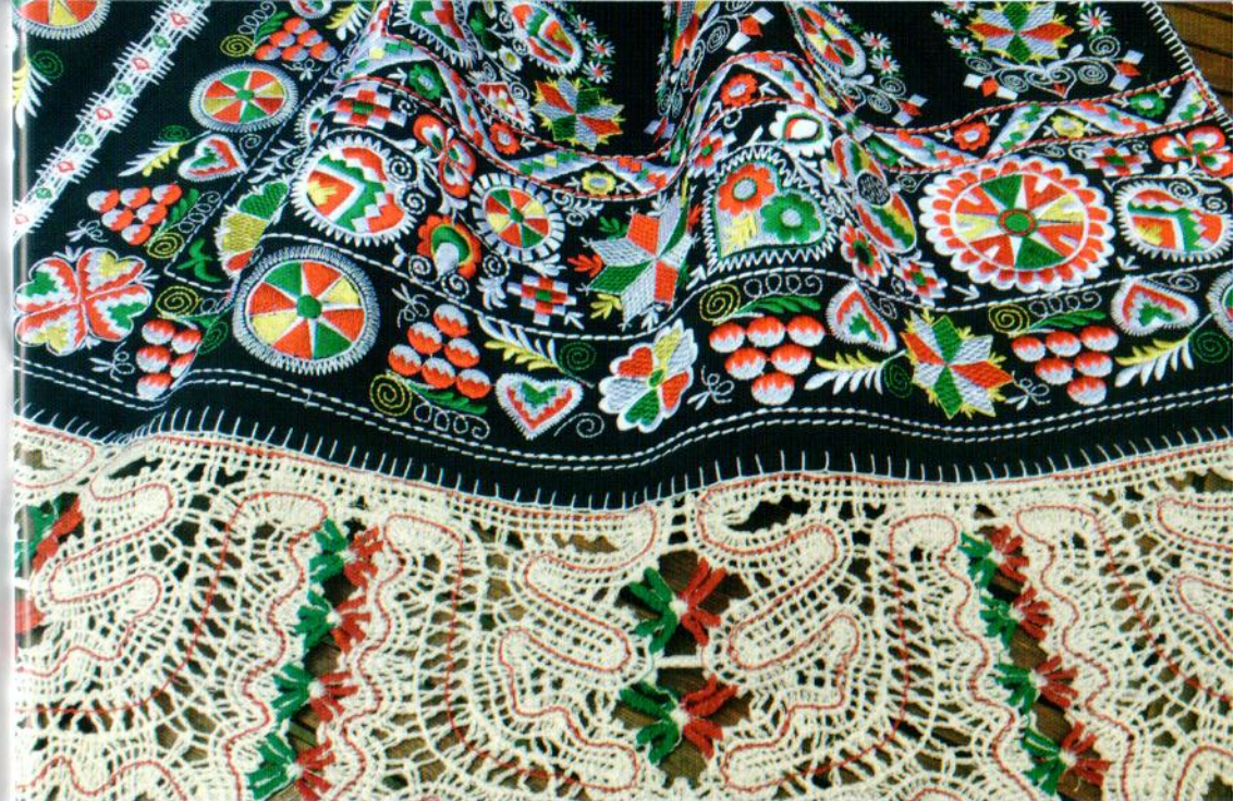
Kyjovsko zástěra, krajky

a krojů pro Cimbálovou muziku Notečku a další. Ta si mou práci také chválila. Hledala jsem cesty, jak novým způsobem – pomocí strojů a kombinovaně – docílit co nejvíce autentického vzhledu výšivek, zjednodušit výrobu pro větší množství a tím také cenovou dostupnost.