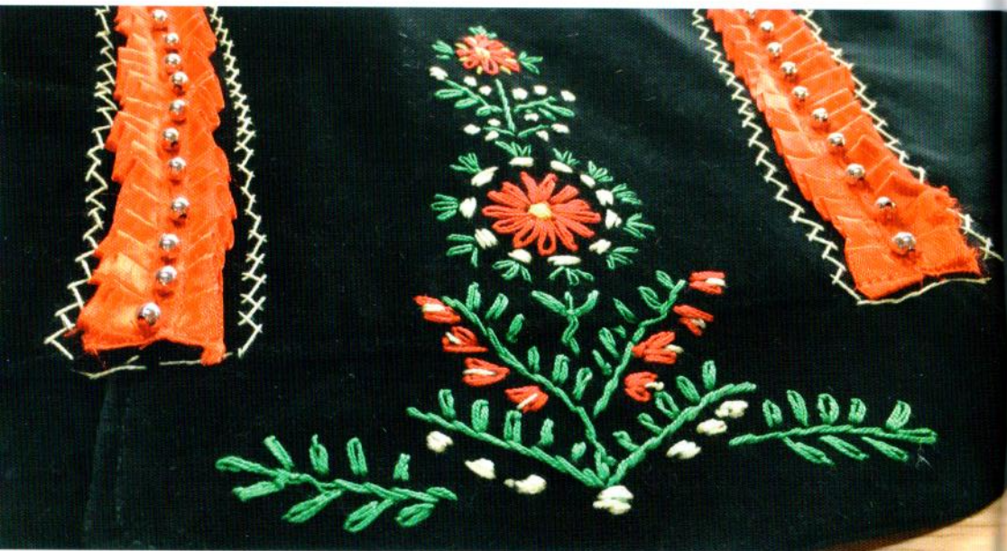
Detail ruční, Podhorácko